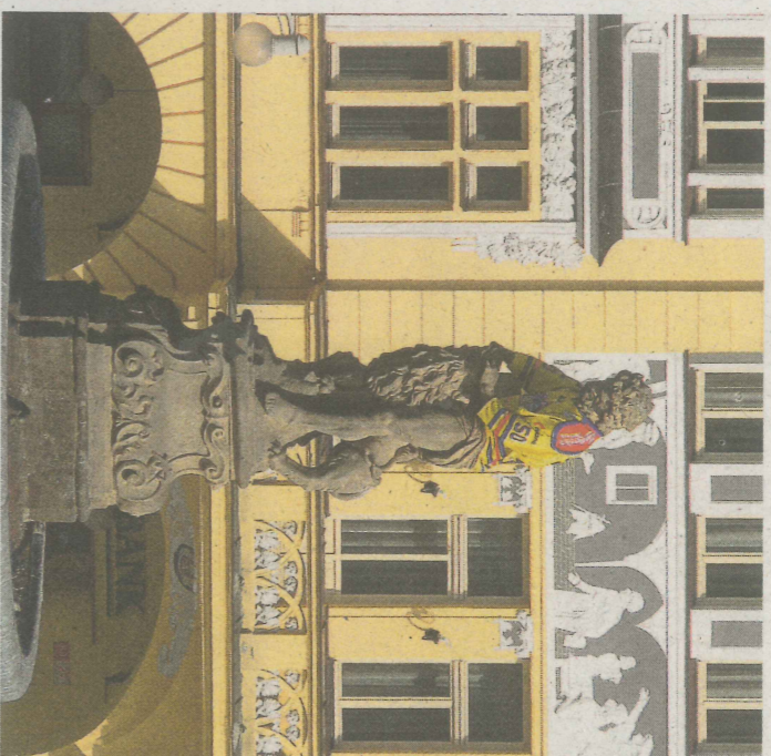
K HOKEJOVÉMU dresu na soše Samsona zaznívají vedle souhlasných hlasů i výhrady.

Když se ale nemůže ozvat němý hrdina, jsou tu ještě lidé, kteří by k obraně Samsona a toho, co reprezentuje, mohli vznést několik vět. Tady jsou: 1. Není dobré považovat Samsona za člena kdeljakého týmu, neboť je nutné rozlišovat věci dočasné a nadčasové. I současnou sportovní euforii doprovází víra, odhodlání a