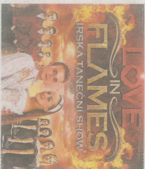
IRSKÝ tanec předvede v Metropolu show Love in Flames.

Ve čtvrtek 16. dubna od 19 hodin představí taneční skupina Merlin, která je rovněž ze Slovenska, svou novou hrukon taneční show Love in Flames . Diváky jistě zaujme taneční virtuozita sólistů a se-